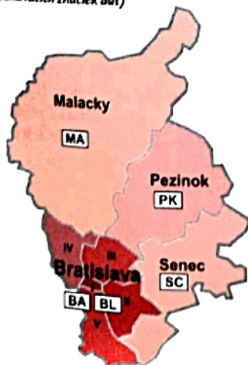
Mapa administratívneho členenia Bratislavského kraja (vrátane poznávacích značiek áut)