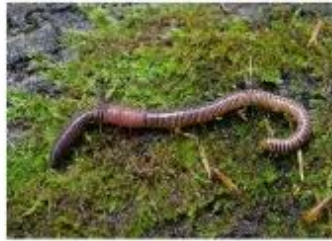
Dážďovka sa dožíva 6 rokov.

Dĺžka života živočíchov je rôzna. Niektoré druhy hmyzu môžu žiť len niekoľko hodín alebo dní, iné živočíchy môžu žiť aj niekoľko desiatok rokov. Živočíchy, ktoré žijú vo voľnej prírode, sa zvyčajne nedoživajú takého vysokého veku, ako živočíchy chované v zajatí.