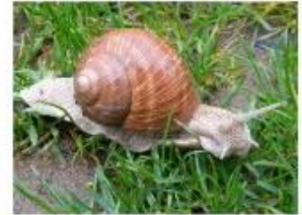
Slimák záhradný žije 6 - 7 rokov.