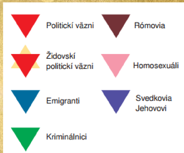
Označenie väžňov v koncentračných táboroch.