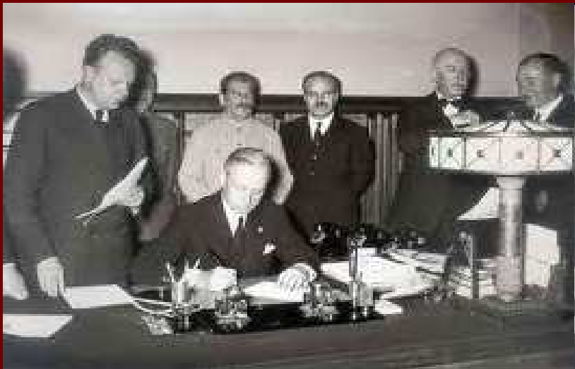
Ribbentrop podpisuje pakt o neútočení