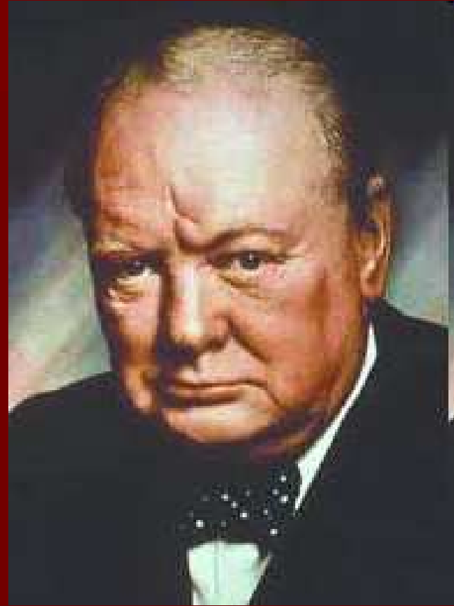
Churchill- predseda vlády Veľkej Británie