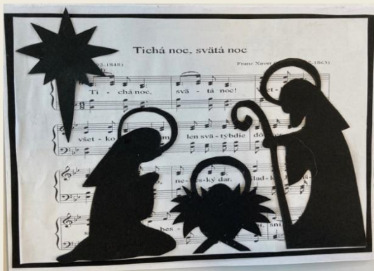
8 Darina Klémová, V.B