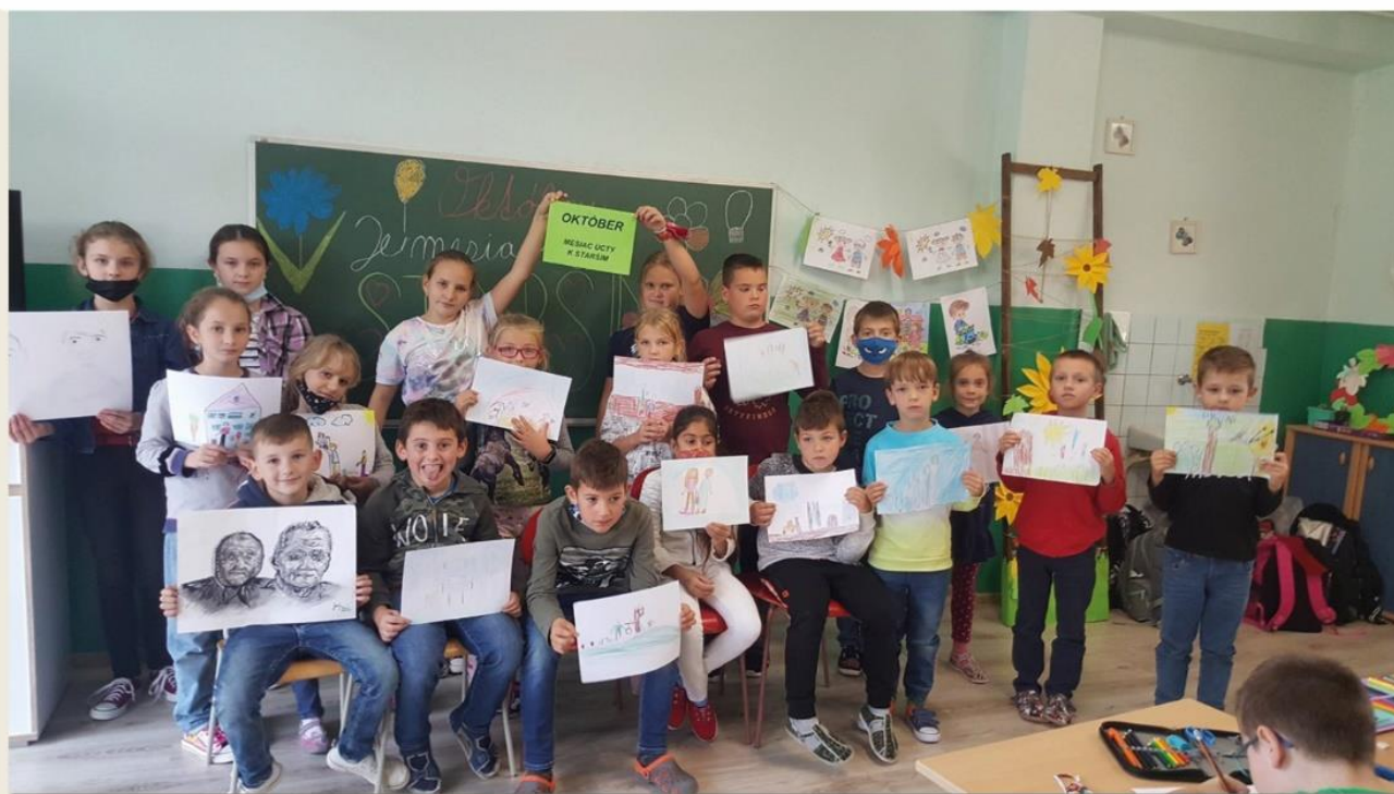
Akcia zrealizovaná v ŠKD