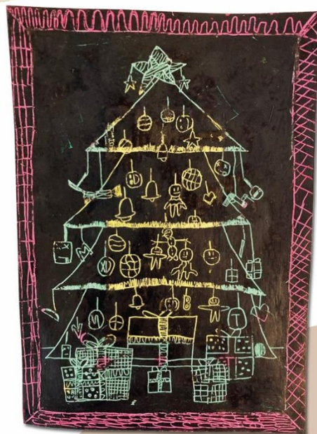
Timotej Bača, IV.A

Pri tom dome lavička, pod ňou tečie vodička.